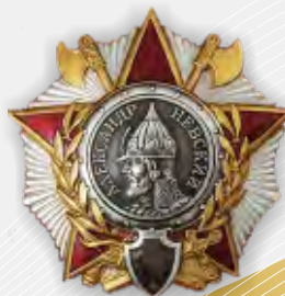
Орден Александра Невского